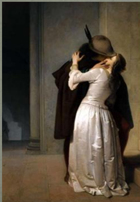
Versione del 1861