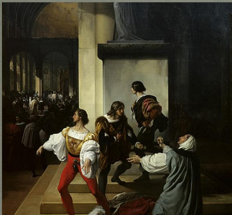
La congiura dei Lampugnani 1826 - 1829

È il più grande dei pittori di storia e utilizza la sua pittura come mezzo di diffusione di una comune coscienza di Nazione a tutti gli italiani, proponendo un glorioso passato a favore della libertà e contro la tirannide straniera.