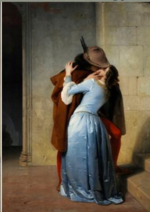
Versione del 1859